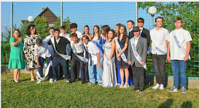
↑ Rozloučení s devátou třídou

Během letních prázdnin začala také kompletní renovace dvou učeben a tří kabinetů. Na tuto rekonstrukci jsme získali finance z dotace IROP. Věděli jsme, že rekonstrukci do začátku nového školního roku nestihneme a školní rok budeme začínat v omezeném režimu bez dvou učeben. Momentálně je v nich hotová nová elektřina, prostory jsou vymalované a v obou učebnách jsou připraveny v první fázi podlahy. Zbývající práce budou pokračovat během září a října. Věřím, že se dokážeme ve škole během probíhající rekonstrukce poskládat a nové učebny s moderními pomůckami budeme moci využívat co nejdříve.