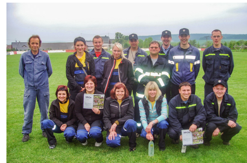
↑ Účastníci soutěže v Cerhovicích, kde družstva mužů i žen získala 3. místo

Za poslední roky se SDH věnuje odborné přípravě, údržbě techniky, kolektivitu mladých hasičů, požárnímu sportu, pomoci městysu Cerhovice a v neposlední řadě zásahové činnosti, kde za zmínku stojí zásah v minulém roce při požáru průmyslové haly firmy Novares. A také se pořádaly nové dýchací přístroje Drager v počtu 4 kusů.