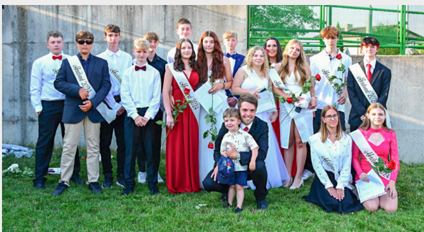
↑ Rozloučení s devátou třídou