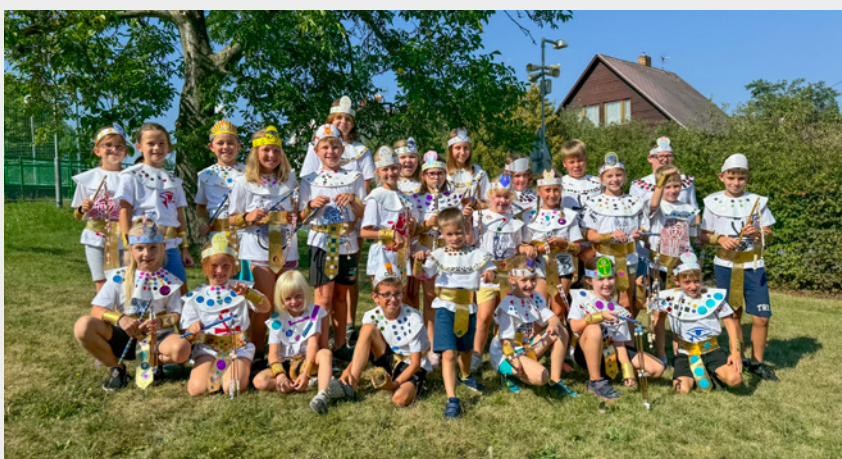
↑ Příměstský tábor na téma Starověký Egypt