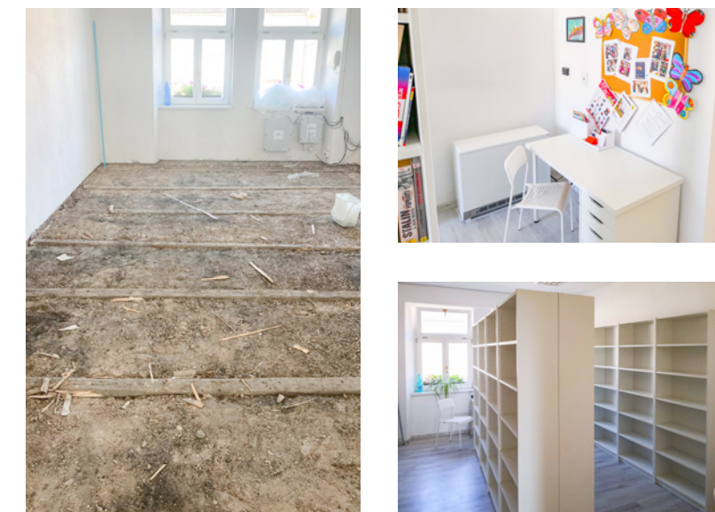
↑ Rekonstrukce proběhla skutečně doslova „od podlahy“

Velice musím poděkovat všem zaměstnancům naší organizace, kteří se zapojili do stěhování, vyklizení a příprav stavebních prací. Ač je totiž dotace na učebny a kabiny velká, je zcela určena na rekonstrukci, ale už ne na vyklizení starého nábytku a učebních pomůcek. Moc si vážím a děkuji všem kolegům, kteří s tím pomáhali. Jsem rád, že jim prostředí není lhostejné a chtějí mít kolem sebe moderní a hezké prostory. Do podobné akce se zapojili zaměstnanci již v měsíci květnu, když v době ředitelského volna natírali plot a zábradlí jak ve škole, tak i v celém areálu.