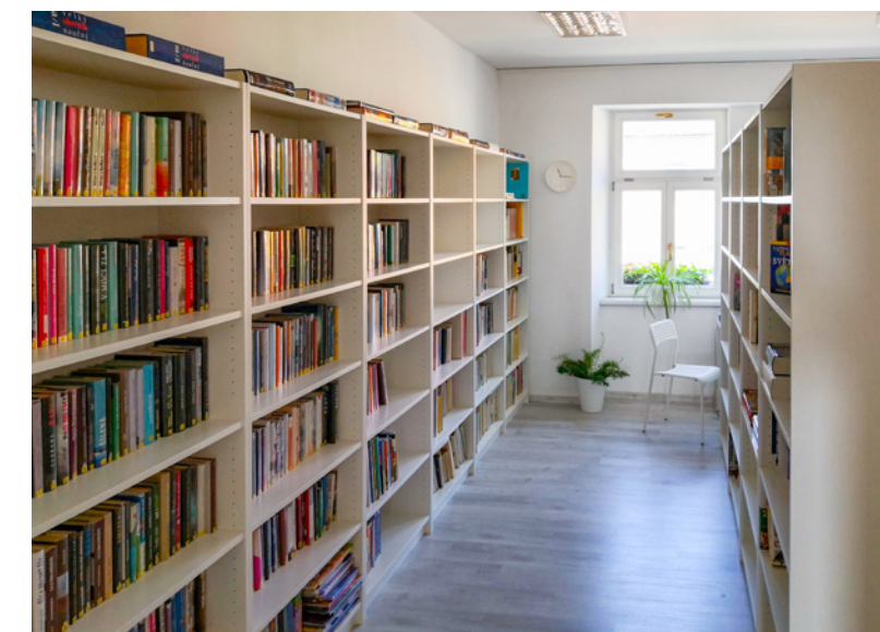
↑ Zrekonstruované prostory knihovny přivítaly první návštěvníky již v srpnu