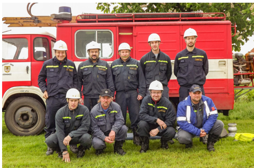
↑ Účastníci soutěže Tlustice 2010

V našem sboru má dlouholetou tradici práce s mládeží. První družstvo mladých hasičů bylo založeno v roce 1957. Od tohoto roku se v družstvech ml. hasičů vystřídalo nespočet mladých členů, kteří s většími či menšími úspěchy reprezentovali náš sbor nejenom na poli sportovním, ale i kulturním. Největších úspěchů dosáhla družstva mladých v devadesátých letech, kdy v kategoriích st. žáků, dorostenců a dorostenek 12krát vyhrála okresní kolo soutěží pro mladé hasiče. Je velice potěšitelné zjištění, že se do práce s mládeží zapojují již sami odchovanci těchto družstev, kteří dosáhli